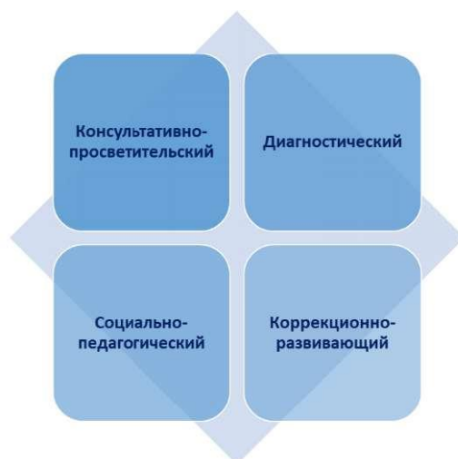
Схема «Структурные компоненты образовательной деятельности по профессиональной коррекции»